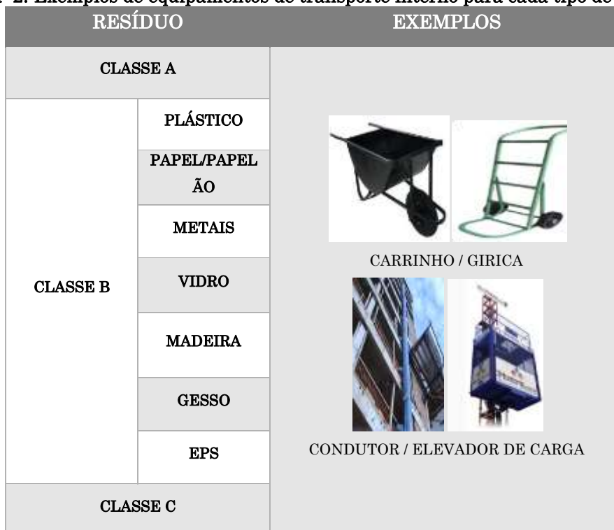
Tabela 2. Exemplos de equipamentos de transporte interno para cada tipo de resíduo.

A seguir são apresentadas as formas de transporte para os diferentes tipos de resíduos (Tabela 2).