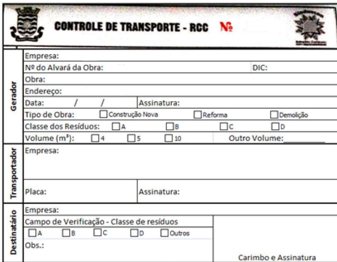
Figura 2. Controle de Transporte de Resíduos.

Para garantir que os resíduos serão encaminhados para o local definido e ambientalmente adequado, deverá ser realizado o Controle de Transporte de Resíduos (CTR), para os resíduos Classe A e B, conforme ilustrado na Figura 2.