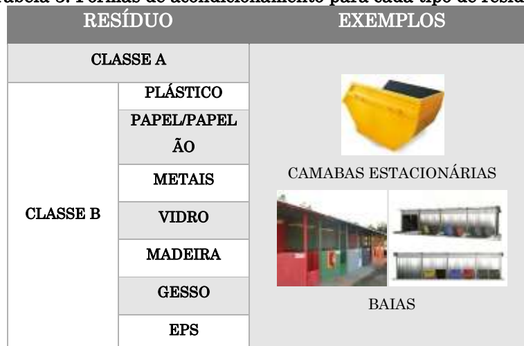
Tabela 3. Formas de acondicionamento para cada tipo de resíduo.

A forma de acondicionamento varia de acordo com as características do resíduo e o volume, conforme a Tabela 3, devendo estar localizadas em local coberto, seco e impermeabilizado.