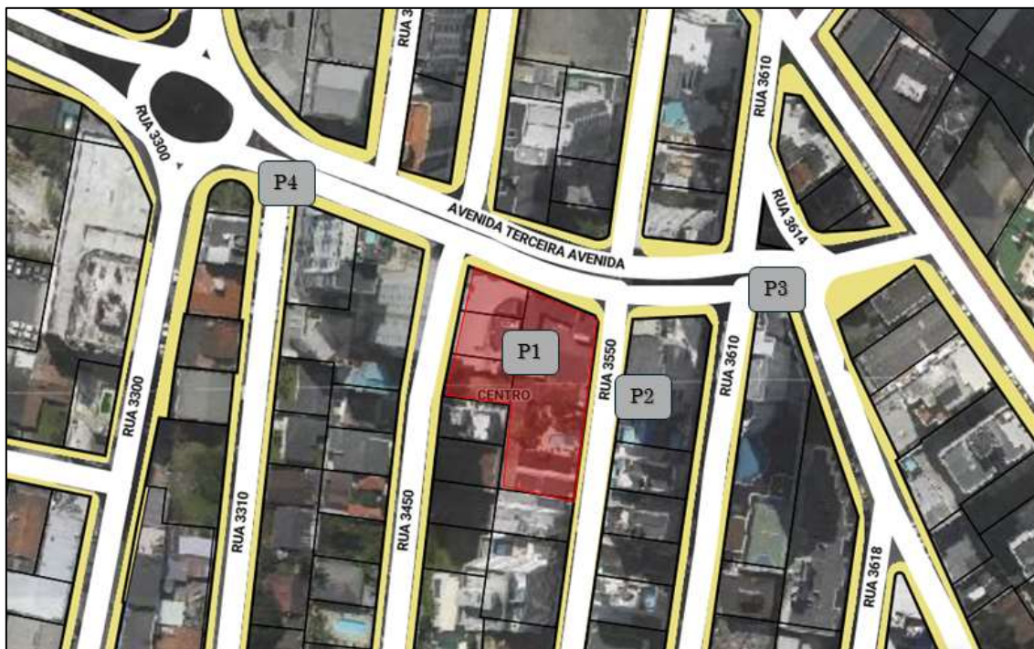
Figura 1. Pontos de medição de ruído.

O local onde está localizado o empreendimento foi caracterizado como uma área mista com predominância de atividades comerciais e/ou administrativas, de acordo com a Tabela 3 da NBR 10151:2019 (Figura 2), assim assume-se o limite de 60 dB para a referida área no período diurno e 55 dB para o período noturno.