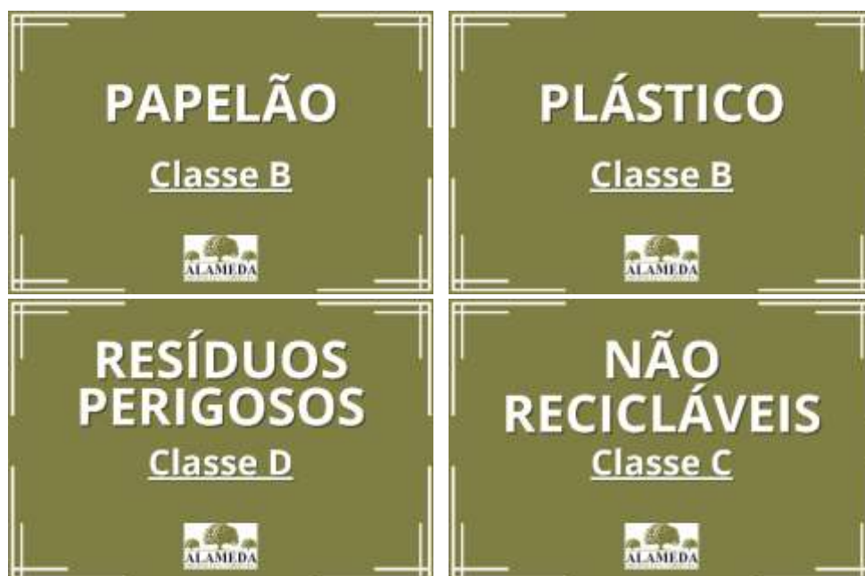
Figura 1. Exemplos de placas de identificação dos resíduos nas respectivas baias.

Os resíduos de lâmpadas usadas não quebradas deverão ser acondicionados em bombonas plásticas com tampa revestida com saco de ráfia em local interno da obra, a fins de mantê-las inteiras. Os resíduos de lâmpadas quebradas deverão ser acondicionados em sacos plásticos dentro da baia de resíduos perigosos (Classe D). Os resíduos perigosos (Classe D) deverão ser acondicionados em locais bem sinalizados e manuseio restrito.