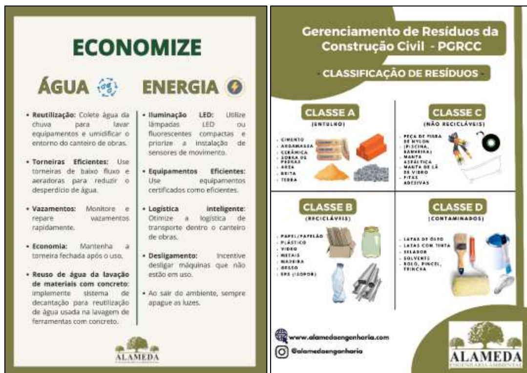
Figura 1: Informativos ambientais para fixação em obra.

Os assuntos a serem abordados nas ações, palestras, orientações, materiais informativos deverão ser principalmente sobre segregação dos resíduos, economia de água e energia.